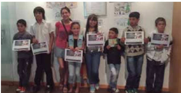
Los artistas posan con sus diplomas