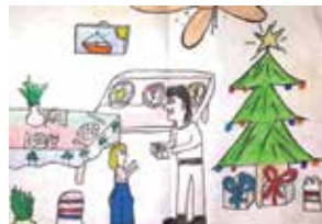
Nicolás Rodríguez, 3 er premio